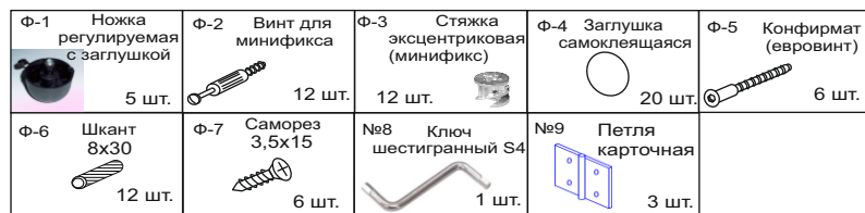
Таблица фурнитуры тумбы